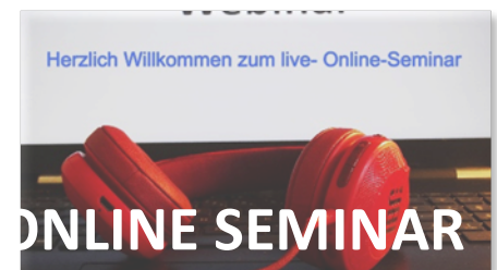
Die drei Online-Angebote von EQAsce, TiGA und GenoAkademie.